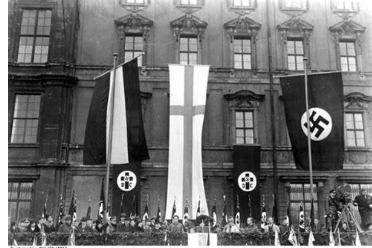
19. November 1933